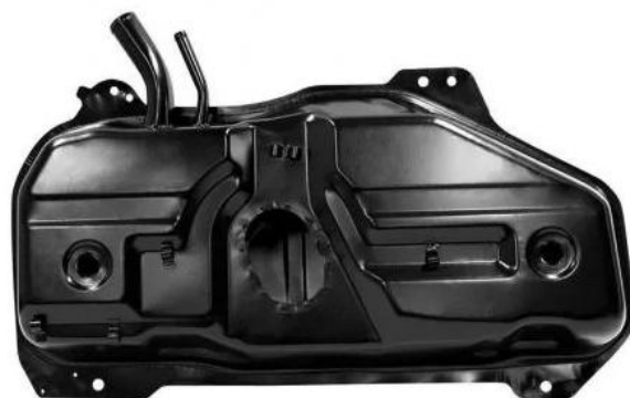
Figura 1 – Tanque de combustível (Luiza, 2021).

Segundo Suzuki (2007), os principais componentes do tanque de combustível são: o reservatório, gargalo de reabastecimento, bomba de combustível, filtro de combustível, válvula anti-refluxo, cinta de fixação, linhas de alimentação e retorno. A figura 1 ilustra um tanque de combustível comum.