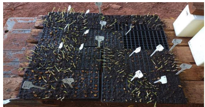
Figura 4 – Gemas com 5 dias dispostas nas bandejas.