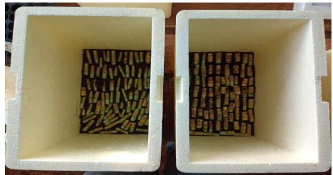
Figura 2 – Gemas alocadas na câmara úmida.

As aferições para coleta dos dados mencionados foram realizadas a cada 10 dias, contabilizando duas aferições ao longo do experimento. Foram coletadas informações das mudas nas bandejas, sendo escolhidas 5 plantas aleatórias para as aferições, e, somente aos 20 dias (Figura 5), foi realizada a análise destrutiva, onde foram coletados dados sobre o comprimento da maior raiz, o número de raízes e o comprimento da maior folha e massa de matéria seca das diferentes estruturas vegetativas da muda.