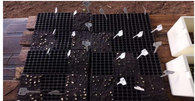
Figura 3 – Gemas alocadas fora da câmara úmida, diretamente nas bandejas.