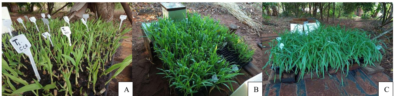
Figura 5 - A – 7 dias após plantio das gemas; B – 10 dias após plantio das gemas; C – 20 dias após plantio das gemas

Os dados foram submetidos à análise de variância, e os efeitos significativos do teste F ( p = 0,05 ) foram comparados pelo teste de Tukey a 5% de probabilidade. O software SISVAR (Sistema para Análises Estatísticas Experimentais) foi utilizado para as análises.