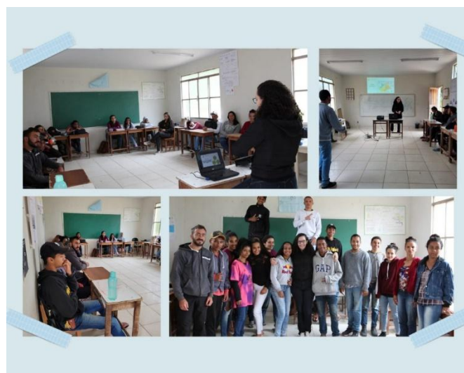
Figura 2 – Oficina de educação ambiental relacionada ao saneamento rural na EFACIL.