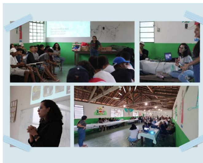
Figura 1 – Oficina de educação ambiental relacionada ao saneamento rural na EFASA.

Percebe-se através das imagens apresentadas o envolvimento dos presentes para com a oficina realizada, bem como o envolvimento dos facilitadores para com os estudantes. A Figura (2) nos permite visualizar a oficina ocorrida na EFACIL, onde 19 estudantes acompanharam a atividade na sala de aula.