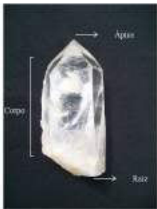
Figura 2. Terminologia proposta para os cristais de quartzo.

Para organizar e estudar as coleções a principal abordagem é a Análise Tecnológica, que permite restituir as peças em seus lugares no seio de uma cadeia operatória (MAUSS, 1947; MAGET, 1953; LEROI-GOURHAN, 1966; INIZAN et al. , 1995; PELEGRIN, 1995, 2004, 2005; etc.), utilizando a classificação morfo-tecnológica, a partir de um nível de hierarquização para cada elemento, o que permite julgar a homogeneidade técnica da coleção (RODET, 2006). Para isto, é necessário cruzar os dados observados sobre os suportes dos utensílios, sobre os núcleos e sobre os brutos de debitage, o que permitirá isolar as grandes tendências das séries estudadas (TIXIER ET AL, 1980; PERLÈS, 1991; GENESTE, 1991; BOEDA, 2001; PELEGRIN, 1995; 2005).