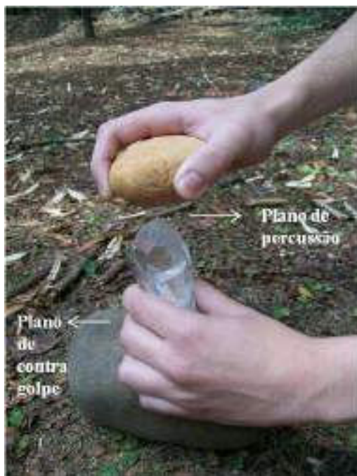
Figura 3. Cristal de quartzo posicionado na bigorna e pronto para receber o golpe em split .

Assim, durante o lascamento, o cristal de quartzo foi colocado com a raiz apoiada sobre uma bigorna de arenito e lascado com percutores de seixo de quartzito e arenito. O golpe foi desferido verticalmente sobre o ápice, em split , utilizando o setor plano do percutor, criando frentes de fratura que se desenvolvem longitudinalmente (com ondas que vão do ápice à raiz e vice-versa - fig. 3).