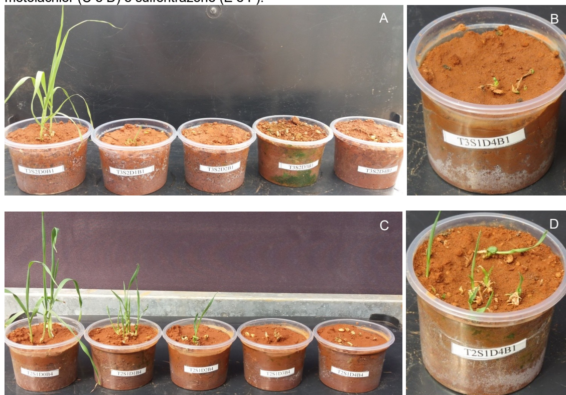
Figura 3: Avaliações de intoxicação das plantas submetidas aos herbicidas dimethenamid (A e B), S-metolachlor (C e D) e sulfentrazone (E e F).

A redução na altura das plantas de trigo e os sintomas de intoxicação dizem respeito ao sítio de ação dos herbicidas. Os herbicidas dimethenamid e S-metolachlor são absorvidos pelo epicótilo da plântula, impedindo o crescimento da parte aérea e das raízes (SILVA, 2019). A clorose nos tratamentos com o herbicida sulfentrazone é ocasionada pela diminuição na síntese de clorofila, enquanto a necrose é advinda das espécies reativas de oxigênio, induzidas pelo acúmulo de protoporfirina IX (ASSUNÇÃO et al., 2017; MARCHI et al, 2008).