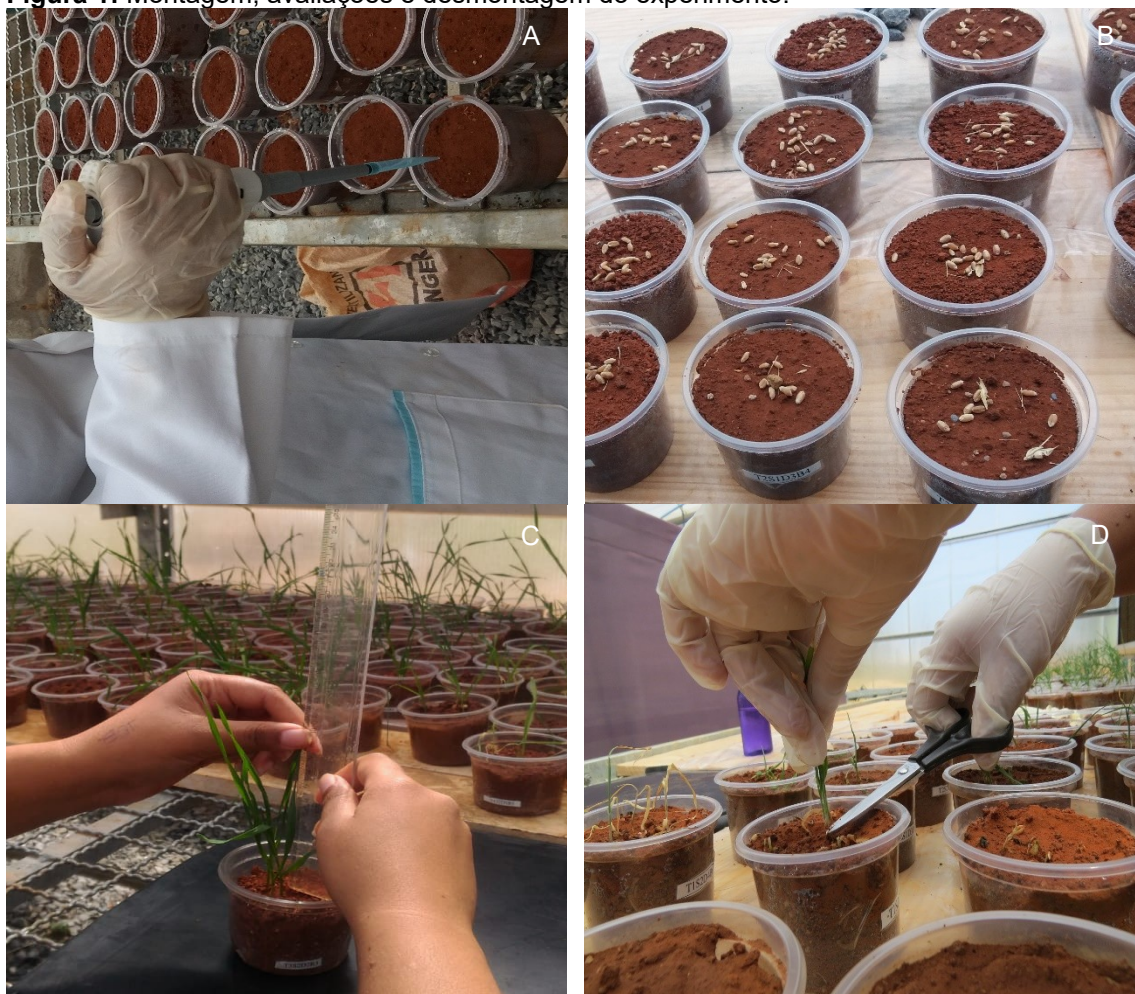
Figura 1AB: Aplicação dos herbicidas com micropipeta de precisão e semeadura das sementes de trigo 24h depois. Figura 1C: Avaliação de altura utilizando régua graduada em cm. Figura 1D: Desmontagem do experimento e condicionamento de parte aérea e raiz em sacos de papel.

Os resultados das avaliações foram submetidos à análise de variância ( p \leq 0,05 ), com auxílio do software estatístico SISVAR® (FERREIRA, 1998). A regressão foi ajustada com o SigmaPlot® versão 11 (SYSTAT SOFTWARE Inc., 2008). As avaliações de altura tiveram o ajuste ao modelo logístico de Seefeldt (Equação 1) (SEEFELDT et al. 1995).