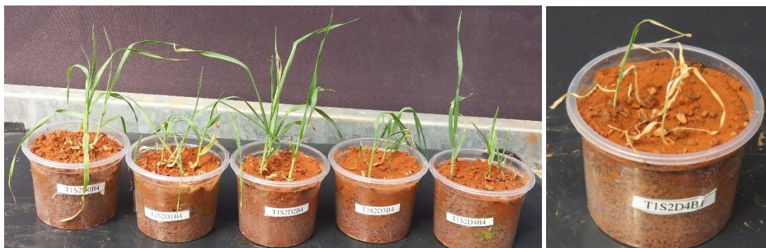
Figura 3A: Plantas de trigo no solo argiloso, submetidas ao herbicida dimethenamid aos 21 DAE, dispostas em ordem crescente de doses. Figura 3B: Tratamento com o herbicida dimethenamid, no solo franco-argilo-arenoso, na dose comercial para soja aos 28 DAE. Figura 3C: Plantas de trigo no solo franco-argilo-arenoso submetidas ao herbicida S-metolachlor aos 28 DAE, dispostas em ordem crescente de doses. Figura 3D: Tratamento com o herbicida S-metolachlor, no solo franco-argilo-arenoso na dose comercial para soja aos 28 DAE. Figura 3E: Plantas de trigo no solo argiloso submetidas ao herbicida sulfentrazone aos 28 DAE, dispostas em ordem crescente de doses. Figura 3F: Tratamento com o herbicida sulfentrazone, no solo argiloso na dose comercial para soja aos 28 DAE.

Os tratamentos com os herbicidas dimethenamid e S-metolachlor, obtiveram os menores valores de massa seca, apresentando redução a partir da dose de 25%. No geral os valores de massa seca foram inferiores para parte aérea. Isso ocorre porque esse é o principal sítio de ação desses herbicidas. O dimethenamid e S-metolachlor atuam no epicótilo das gramíneas e o sulfentrazone reduz a produção fotossintética (SILVA, 2019; BUENO et al., 2012)