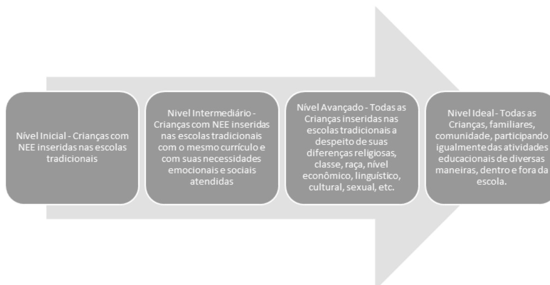
Figura 2. Expandindo conceitos de inclusão: quatro níveis (adaptado de TOPPING, 2012, pág. 13)

Com base nas evidências encontradas na literatura estudada, podemos classificar o nível atual de inserção das práticas inclusivas na imensa maioria das escolas brasileiras como sendo o nível inicial de um processo de 4 níveis: