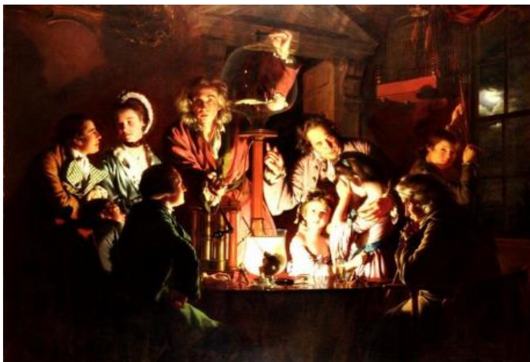
Figura 3: O experimento com um pássaro na bomba de ar (1768), Wright (2015).

Observa-se, ainda, como a mulher em prantos é acalentada pelo homem que busca explicar o experimento, enquanto a criança a tudo assiste sem temor, e outros observam atentos a explicação dada. Além do que, todo o cenário é lúgubre, dando a sensação de uma atmosfera escurecida, sendo a ciência interpretada como uma luz na escuridão. Um detalhamento pormenorizado dessa obra pode ser estudado em Gorri e Santin Filho (2007).