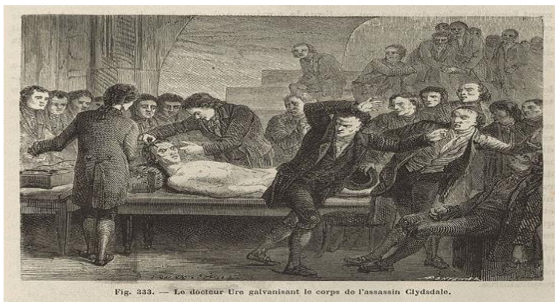
Figura 1: "O doutor Ure galvanizando o corpo do assassino Clydsdale". Ilustração de "As maravilhas da Ciência" (1867) por Louis Figuier (FIGUIER, 1867).

Note-se que o horror gerado na plateia provocou fortes reações, fazendo com que as pessoas fugissem dali, certamente assustando-se e recusando tal feito, o que pode ser observado abaixo, na gravura (figura 1) sobre o procedimento realizado por Ure (1819).