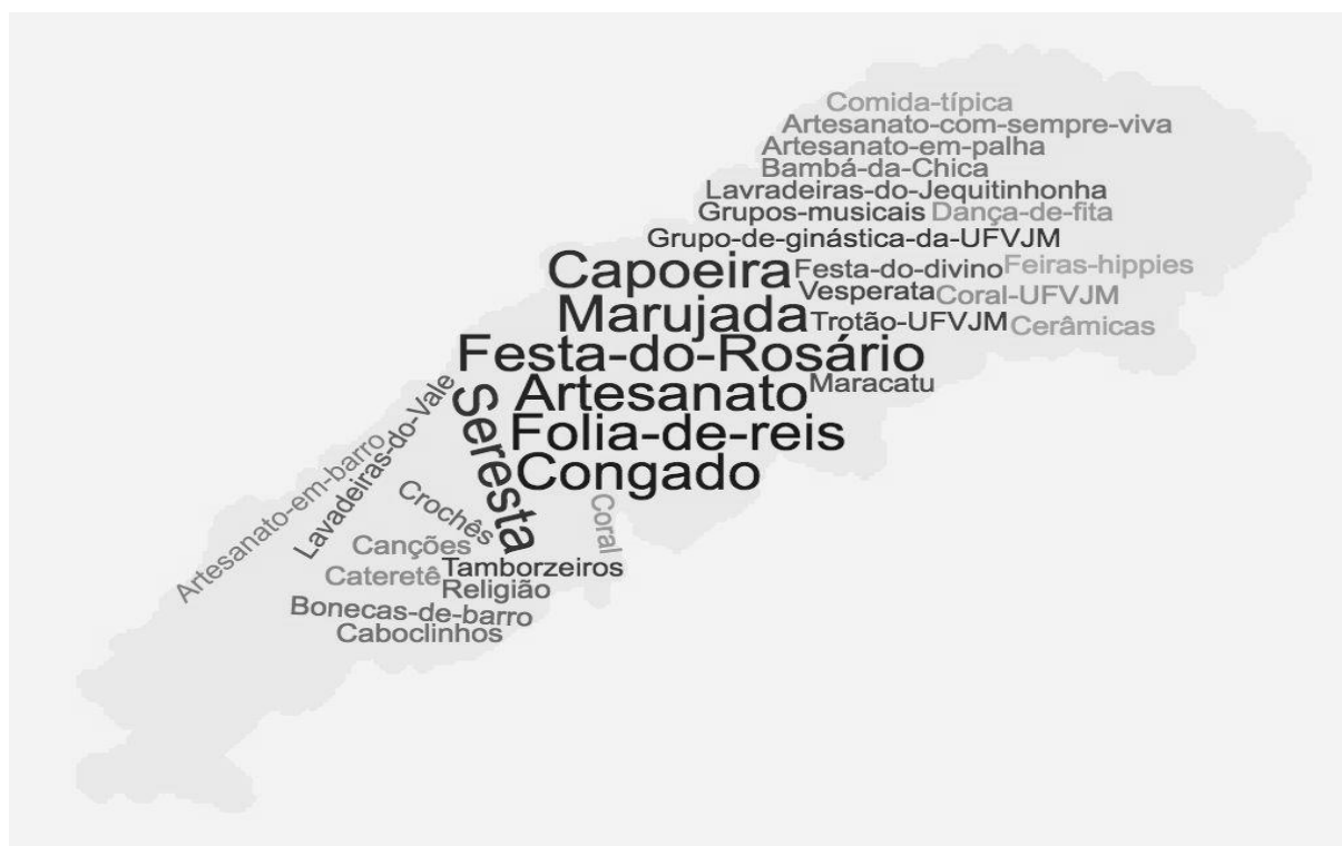
Figura 01 – Manifestações da cultura popular da região de abrangência da UFVJM ( Campus Diamantina).

Para apresentar as manifestações citadas pelos sujeitos, utilizamos um gráfico de nuvem de palavras, recurso digital que mostra o grau de frequência com que as palavras foram citadas em um texto, de acordo com a figura 01: